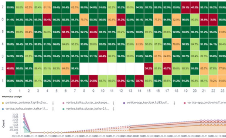
MAPA DE CALOR

Interface amigável e intuitiva que oferece uma visão consolidada do estado do ambiente.